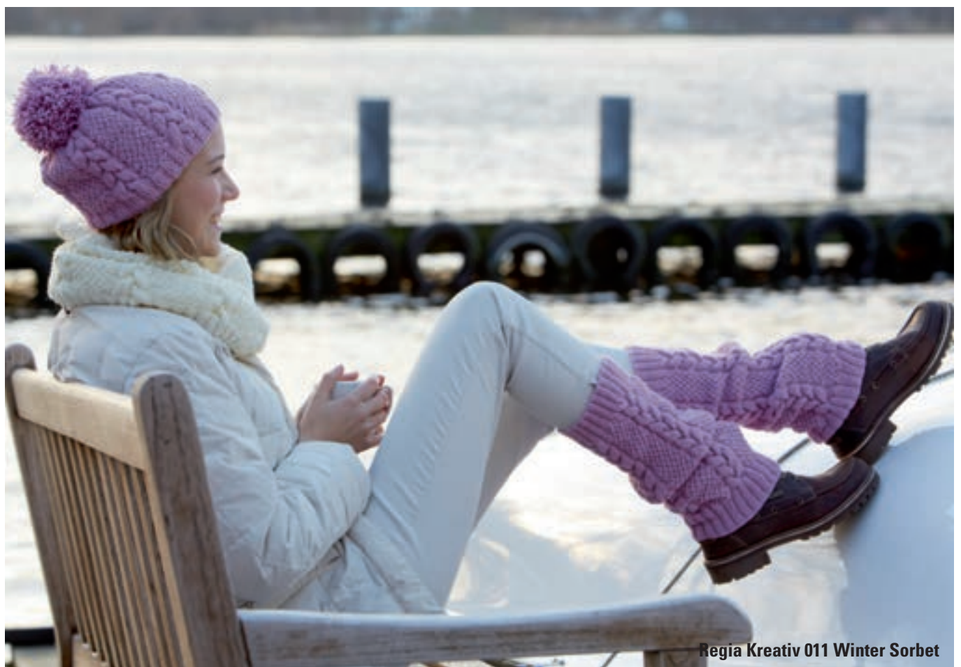
Regia Kreativ 011 Winter Sorbet